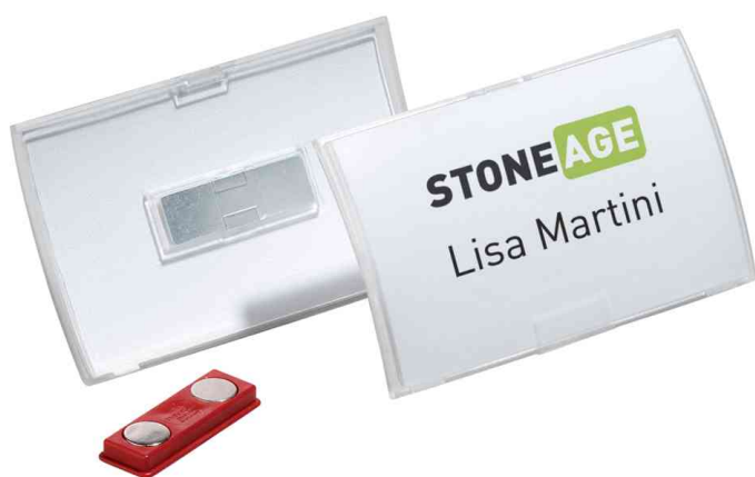
Visuel de référence: Badge Click Fold, avec aimant