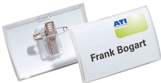
Visuel de référence: Porte-badge Click Fold, avec pince combi