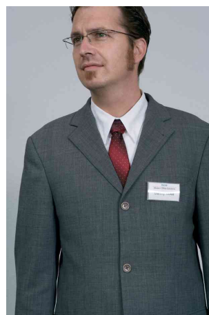
Porte-badge Click Fold, exemple d'utilisation