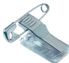
Pince & épingle