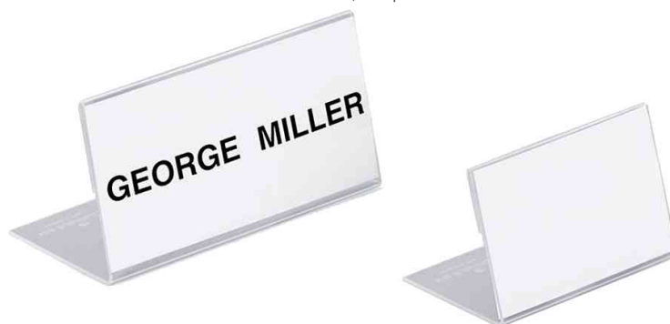
Visuel de référence: Porte-noms en forme L