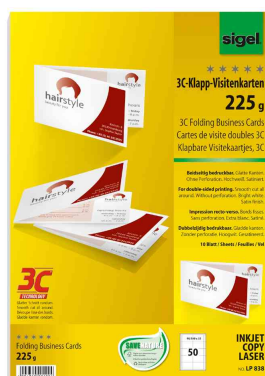
carte de visites double 3c