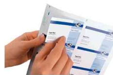
Personnaliser à l'aide du PC - imprimer - décoller