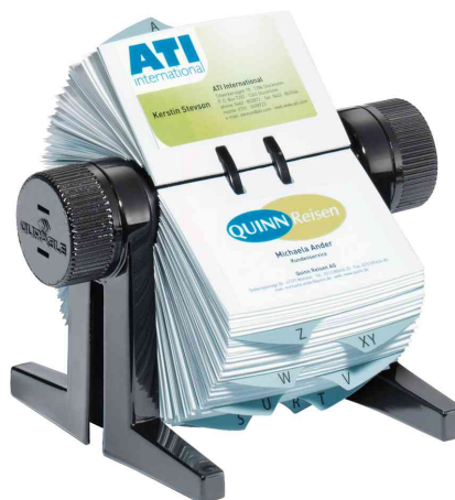
Fichier rotatif pour cartes de visite VISIFIX® cubo