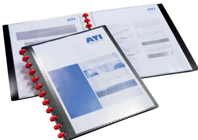
Protège-documents DURALOOK® Easy Plus