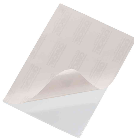
Pochette adhésive POCKETFIX®, recto