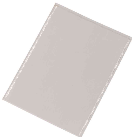
Visuel de référence: Pochette adhésive POCKETFIX®