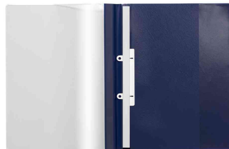
Chemise à lamelle DURAPLUS® de Luxe, ouvert