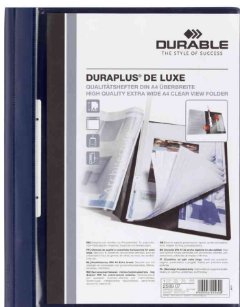
Visuel de référence: Chemise à lamelle DURAPLUS® de Luxe