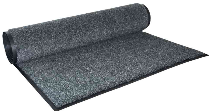
Tapis anti-salissure Olefin