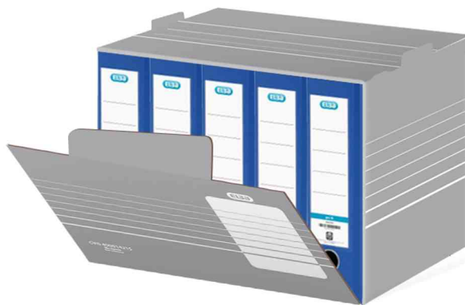
visuel de référence: Conteneur pour archives pour classeur