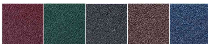
rouge vin - vert - gris - marron - bleu