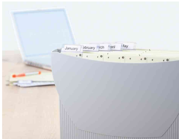
Étiquettes onglets SPECIAL, utilisation