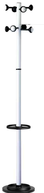
Portemanteau sur pied ACCUEIL, blanc