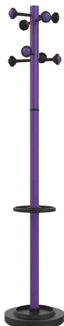
Portemanteau sur pied ACCUEIL, violet