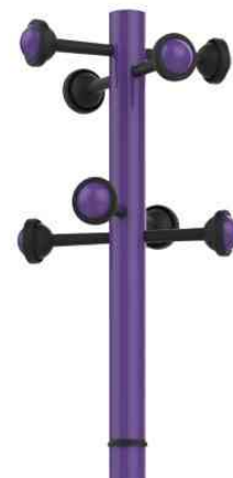
Visuel de référence: vue détaillée des patères