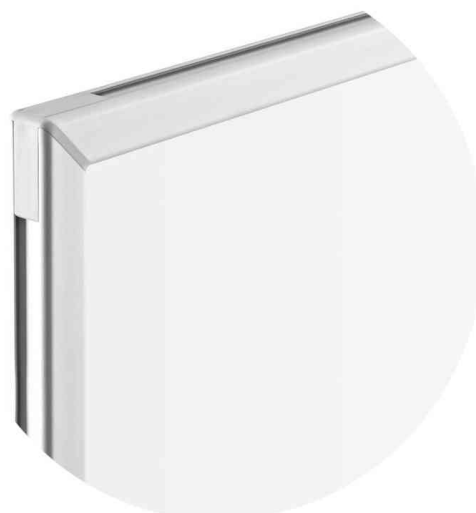
Vue détaillée du cadre de profil