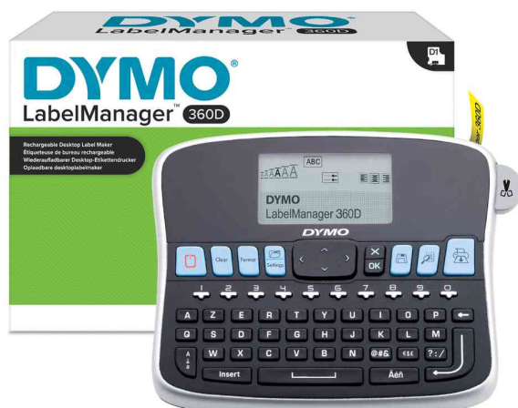
Étiqueteuse de bureau "LabelManager 360D"