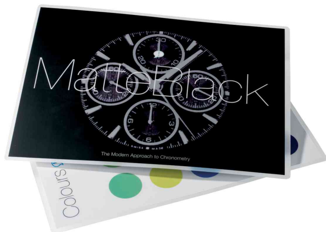
Visuel de référence: pochette de plastification MattPouch