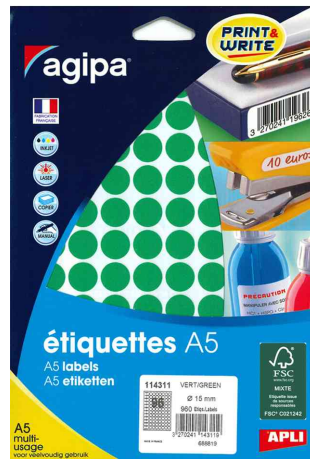
Pastilles de couleur, diamètre: 15 mm