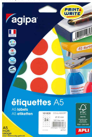
Pastilles de couleur, diamètre: 30 mm