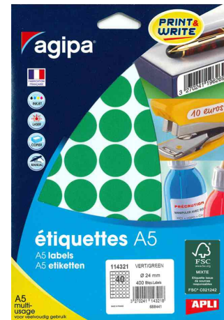
Pastilles de couleur, diamètre: 24 mm