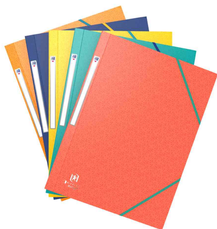
Chemise 3 rabats à élastiques Bicolor Recyc+