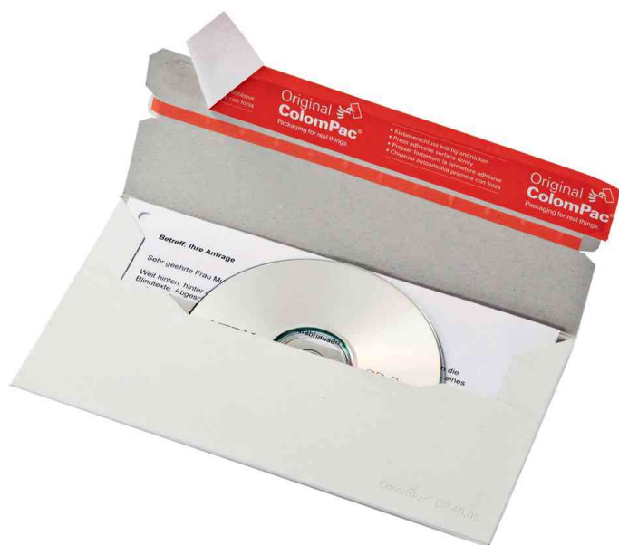
Visuel de référence: Enveloppe d'expédition pour CD / DVD, sans fenêtre