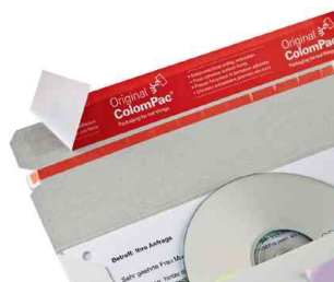
Vue détaillée: fermeture autocollante - bande d'arrachage