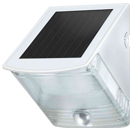
Lampe LED solaire pour l'extérieur SOL 4 plus IP44, blanc