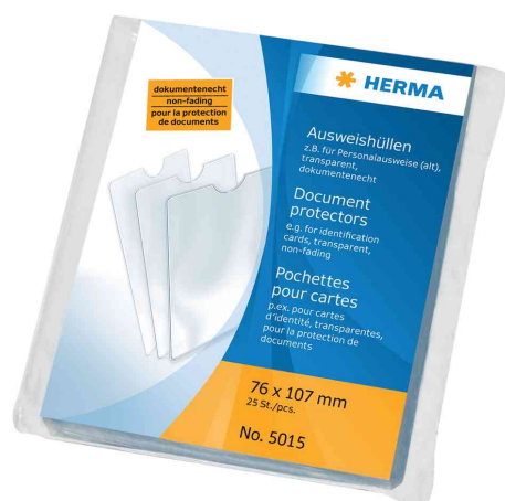
Visuel de référence: Etui de protection, double, emballage