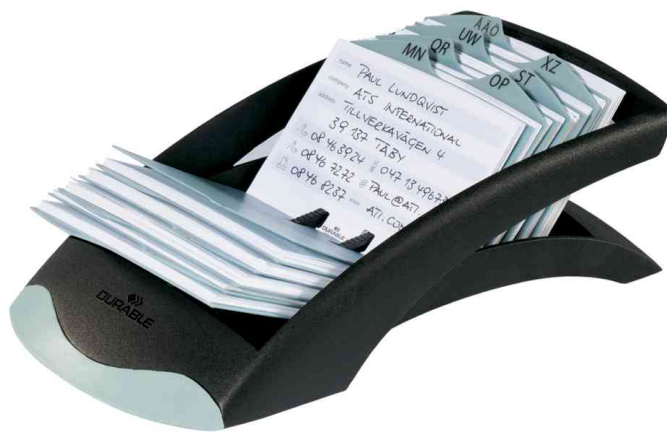
Fiches pour adresses TELINDEX®, noir/gris