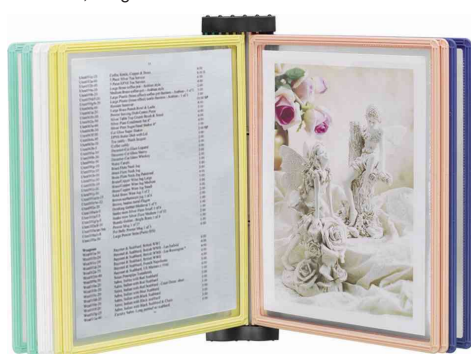
Pivodex support mural