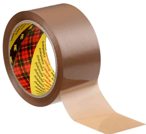
3M Ruban adhésif d'emballage 305, marron