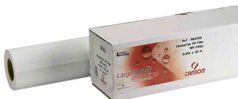
Papier traceur en rouleaux

Nr. de commande 5862490: papier non couché pour lignes de couleur et tracés d'échantillon quotidiens