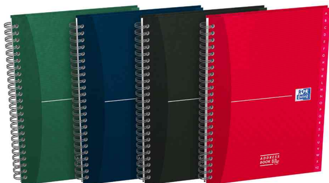
Visuel de référence : Carnet d'adresses Office "Essentials"