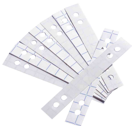
Bande de renforcement de perforation