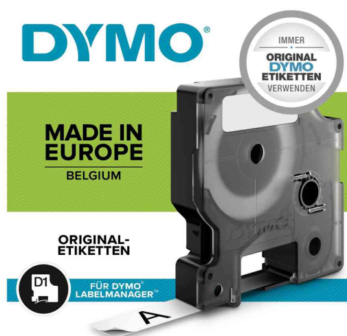
Visuel de référence: Rubans d'étiquette D1, emballage blister

Toujours utiliser des étiquettes Original de DYMO®