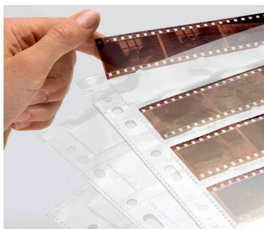
Fotophan Pochettes pour négatifs, utilisation