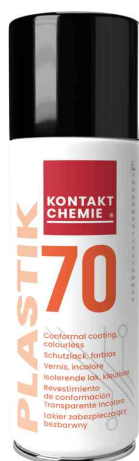
Laque protectrice à haute isolation "PLASTIK 70"